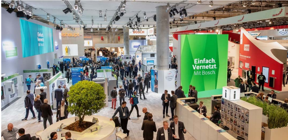
97 Prozent der ISH Besucher sind laut einer repräsentativen Umfrage zufrieden mit ihrem Messeaufenthalt.

Die besucherstärksten Länder waren China, Italien, Niederlande, Frankreich, Schweiz, Großbritannien, Polen, Belgien, Österreich und die Tschechische Republik. Industrie und Handwerk stellten die größten Besuchergruppen. Zudem bestätigen die Kennzahlen der Marktforschung mit 97 Prozent die Zufriedenheit der Besucher mit dem gezeigten Angebot.