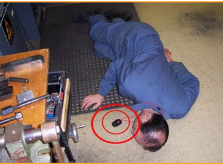
Personennotrufanlage für in Not geratene Personen bei Alleinarbeiten

Aufgabe einer Personennotrufanlage (PNA) ist es, für in Not geratene Personen bei Alleinarbeiten unverzüglich