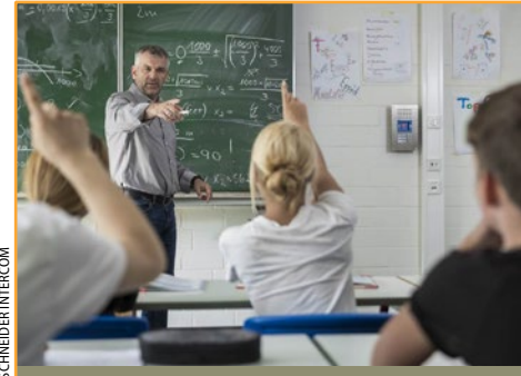
Für Not- und Gefahrenfälle in Bildungseinrichtungen gibt es spezielle Notrufsysteme.