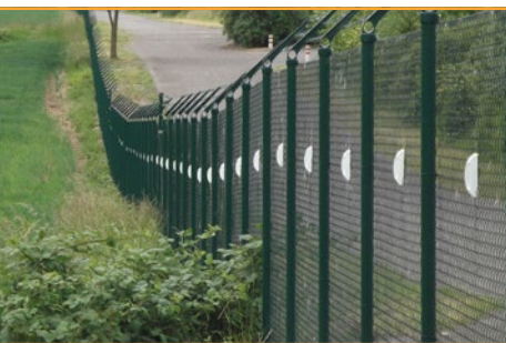
RFID-Sensoren detektieren Schwingungen am Zaun und übertragen die Signale per Funk.