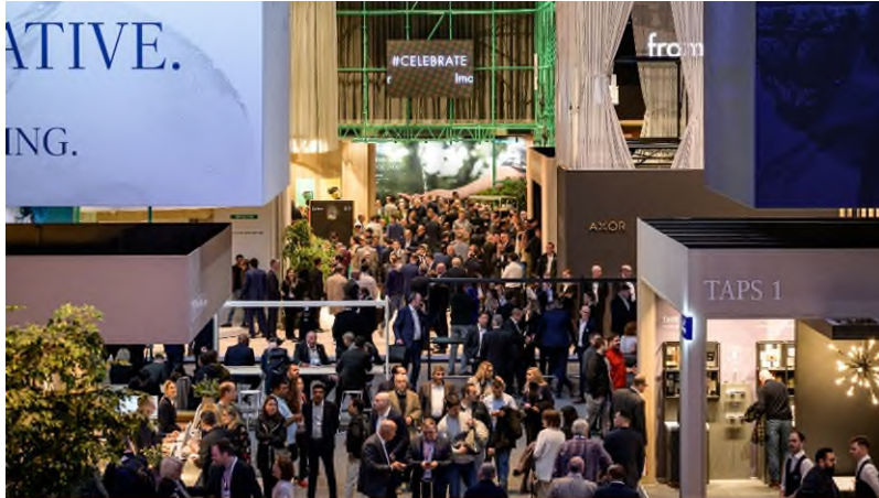
Die ISH 2023 versammelte die gesamte SHK-Branche in Frankfurt am Main.